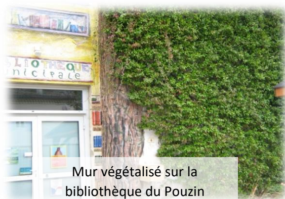
Mur végétalisé sur la bibliothèque du Pouzin

✓ La végétalisation des murs de béton, la plantation d'arbres ou de haies sont des alliés contre le réchauffement climatique, la pollution de l'air, tout en apportant l'abris et le couvert pour les espèces sauvages !